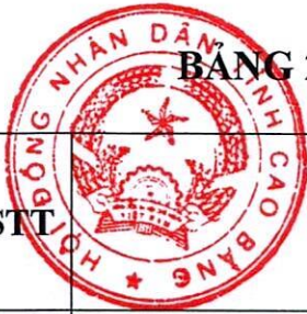
BẢNG 2: HỆ SỐ ĐIỀU CHỈNH GIÁ ĐẤT Ở TẠI ĐÔ THỊ